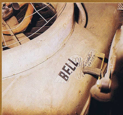
Mini-Hovercraft von 1969 mit MV-Zweizylinder-Zweitaktmotor: Manchmal trug die Kooperation mit der Bell Helicopter Company seltsame Früchte