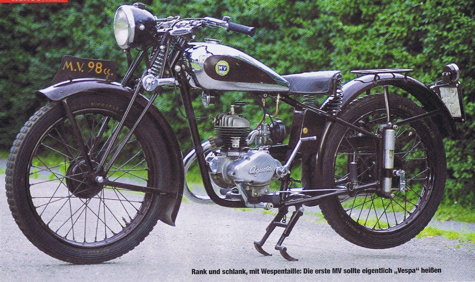
Rank und schlank, mit Wespentaille: Die erste MV sollte eigentlich „Vespa“ heißen