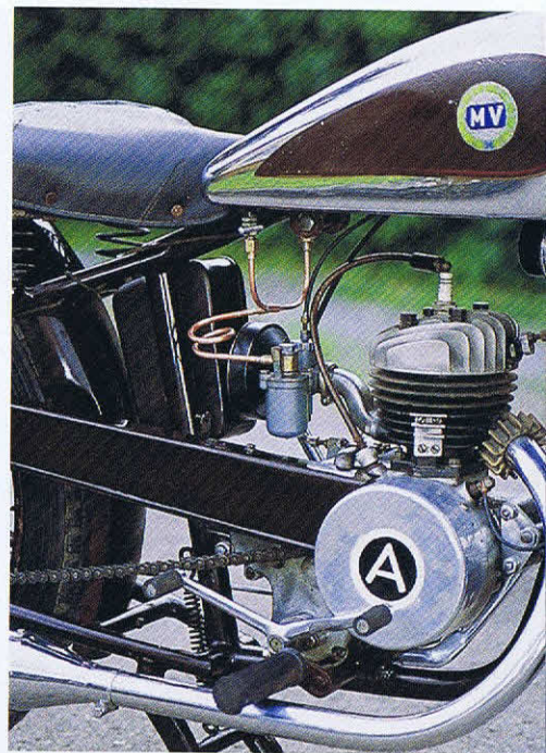
Geradweg-Federung hinten – nun ja, es war eben ein weiteres Verkaufsargument. Denn den möglichen Komfort für den Fahrer definierte nach wie vor der Sattel

wurde im Frühjahr 1945 eigens die Meccanica Verghera (MV) Agusta für die geplante Motorradproduktion gegründet.